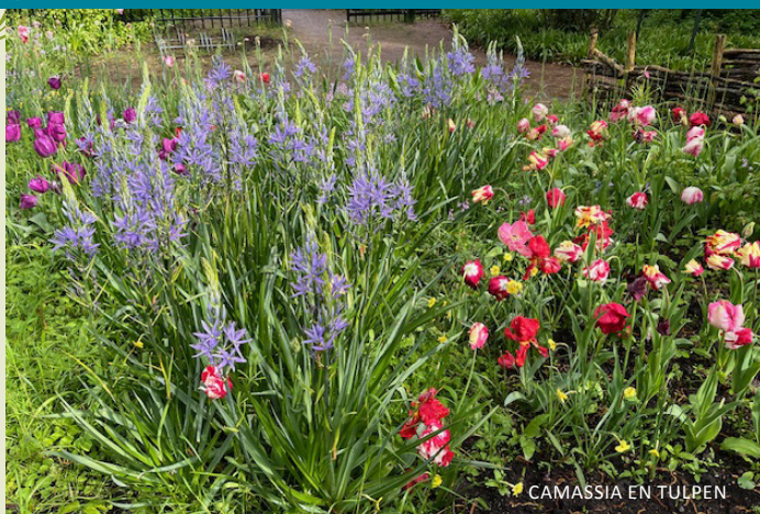
CAMASSIA EN TULPEN