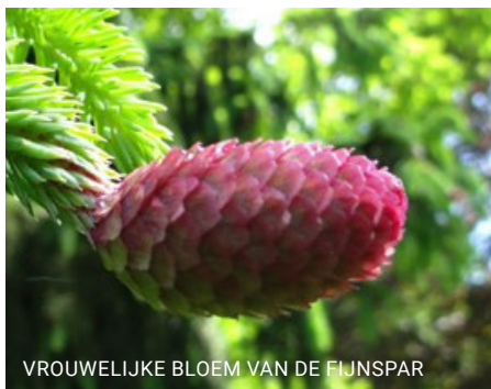
VROUWELIJKE BLOEM VAN DE FIJNSPAR

Op de Pioniers kom je ze best vaak tegen. Ik telde er vorige zomer 13. Veel mensen gunnen hun kerstboom een lang leven door hem voor de aardigheid in de tuin te planten. Oei, de overgang van de warme kamer naar het koude buiten overleven veel bomen niet. Maar er zijn genoeg gelukkigen, sommigen inmiddels meer dan 50 jaar oud en tot 20 meter hoog. Helaas worden de fijnsparren aangetast door de letterzetter; een kevertje dat massaal hout aanvreet en gangetjes maakt aan de oppervlakte die wel op letters lijken. Hele bossen in Duitsland zijn al ten prooi gevallen.