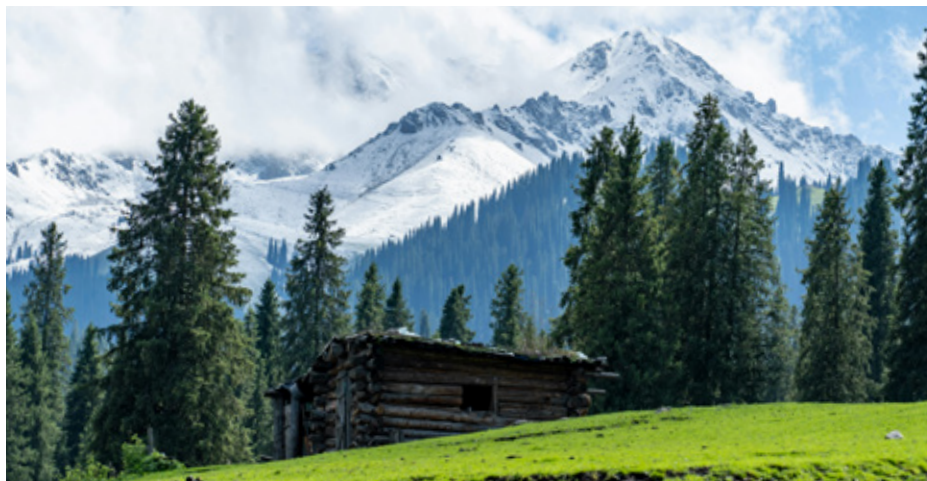
DE OUDSTE BOOM TER WERELD IS MOGELIJK EEN FIJNSPAR IN ZWEDEN (GESCHAT OP 9555 JAAR).