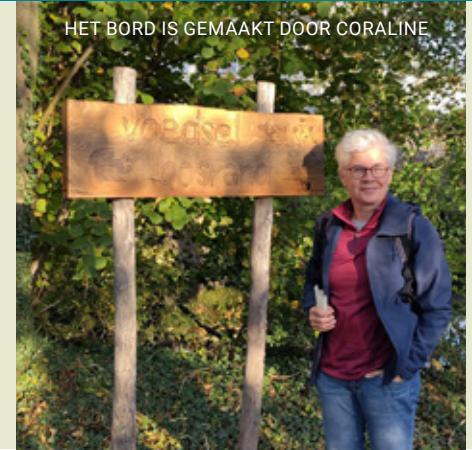
HET BORD IS GEMAAKT DOOR CORALINE